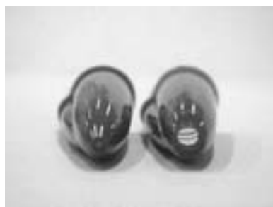
نمونه درپوش خودکار با راه هوا - بدون راه هوا

در صورتیکه سر خودکار بلعیده شده باشد، منفذ مزبور ادامه تنفس را امکان پذیر می‌کند و راه گلو مسدود نمی‌شود. شکل (۲)