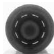
نمونه درپوش ماژیک با راه هوا